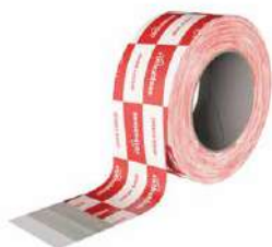
SPEEDY BAND стр. 70