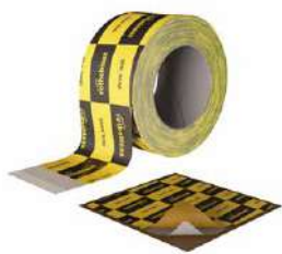
SEAL BAND стр. 64