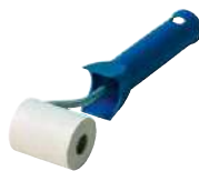
ROLLER стр. 326