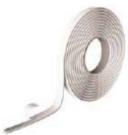
SUPRA BAND стр. 132